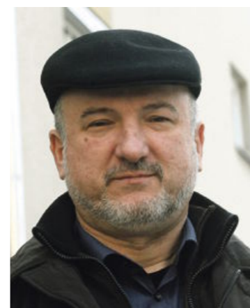
Zoran Miliivojevič Problem je idealizirana predstava o ljubezni, ki nam jo kažejo literatura, filmi, mediji.